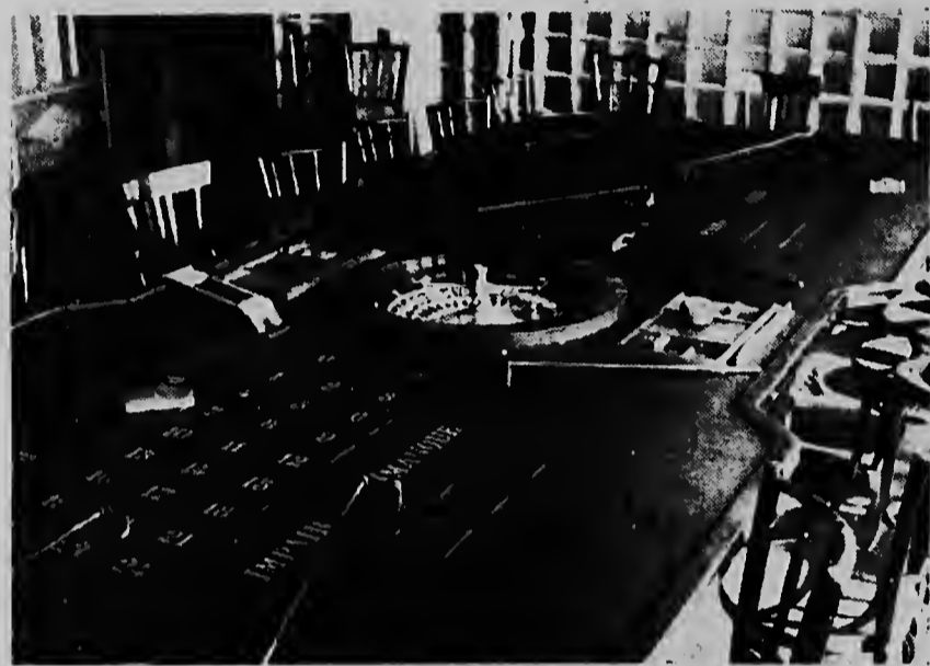
Nog heerst er rust aan de roulettetafel die in de Watapana Club staat geïnstalleerd. Zondag a.s. zal voor het eerst het driftige balletje rondtollen.